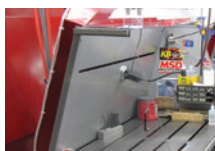
CAMPANA DE EXTRACCIÓN DE HUMOS DE AMOLADO

No obstante, cuando los medios técnicos y las prácticas de trabajo controladas no son viables o efectivos, se utilizarán Equipos de Protección Individual (EPI) que eviten la inhalación de partículas cargadas de berilio y el contacto con la piel; de esta forma evitaremos llevarnos a casa el berilio adherido a la ropa.